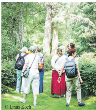
Baumkundliche Führung auf dem Ohlsdorfer Friedhof.

Die Loki Schmidt Stiftung hat wieder viele Partnerinnen und Partner bei der Vorbereitung und Durchführung des Event-Wochenendes. Schon seit dem 20. Mai heißt es bei den Bücherhallen der Stadt „Hamburg blüht auf!“. Hier finden jetzt Umweltaktionen und Führungen für alle Altersklassen statt und es werden wieder 20.000 kostenfreie Samentütchen verteilt, mit denen Naturfreundinnen und -freunde heimische Pflanzen ziehen können, die Insekten als wichtige Nahrungsquelle dienen. Die Aktion wird von der Sparda-Bank Hamburg gefördert.