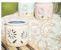
Perfekte Sonnentage, laue Sommernächte – bei einer Auszeit am See kann man bestens entspannen.

derobe kreiert. Mit Schwerpunkt auf handgefertigten Details wie Fransen, Häkelarbeiten, Stickereien und Verzierungen sowie luftigen Kleidern und Kaftanen vermittelt die Kollektion einen eleganten Boho-Look.