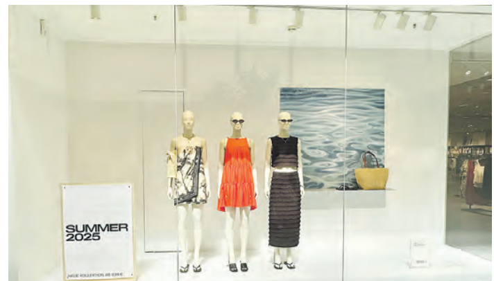
Inspirationen in Sachen Mode und Textil liefern die Bekleidungsfachgeschäfte des Centers.

Für echtes Urlaubs-Feeling in den eigenen vier Wänden bietet Nanu-Nana verschiedene Einrichtungsstile, die so vielfältig sind, wie jeder Einzelne von uns. Egal, ob lustiges Frühstück, italienischer Abend, maritimes oder mediterranes Flair, Märchenwald und Lavendelträume oder kräftige Farben und Natur-Look – hier wird garantiert jeder fündig. Die wechselnden Dekorationsartikel und Wohnaccessoires sorgen für jede Menge Inspiration – drinnen wie draußen. Was dann noch fehlt, ist eine zünftige Grillparty. Im EKT Farmsen finden ambitionierte Griller genau das richtige Zubehör. In den hier ansässigen Supermärkten sowie bei Dehning gibt es Grillfleisch und Würstchen, bei Tee & Gewürze eine Auswahl an Dips und Saucen und im Fischhaus Farmsen Leckereien aus dem Meer. Vegetarische Beilagen wie Paprika oder Mais bereichern die Grillplatte. Dazu passen am besten ein edler Tropfen aus dem Wein-Shop oder ein kühles Bier.