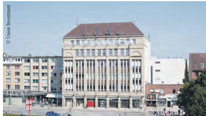
Die ehemalige Karstadt-Immobilie am Wandsbek Markt.