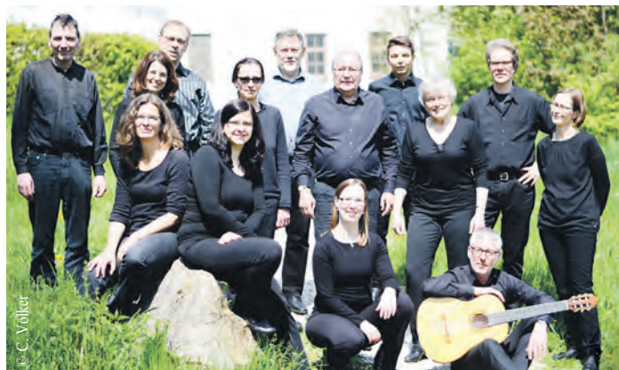
Das Farmsener Gitarrenensemble feiert sein 30-jähriges Bestehen mit einem Jubiläumskonzert.

Der Eintritt zu der Veranstaltung des Volkshochschulvereins Hamburg-Ost e.V. ist frei, eine Anmeldung unter https://www.eventbrite.de/e/30-jahre-farmsener-gitarrenensemble-tickets-1323531591619?aff=oddtcreator jedoch notwendig. Spenden zur Unterstützung des Ensembles sind erwünscht.