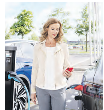
Neben mehr als 1.000 kostenlosen Parkplätzen stehen auch 18 Ladestationen für Elektrofahrzeuge zur Verfügung.

Für ihren Einkauf stehen den Kundinnen und Kunden im direkten Bereich des Centers mehr als 1.000 kostenlose Parkplätze zur Verfügung. Außerdem können zusätzlich insgesamt 18 Ladestationen für Elektrofahrzeuge genutzt werden, die sich gegenüber der Zufahrt zum Parkdeck befinden.